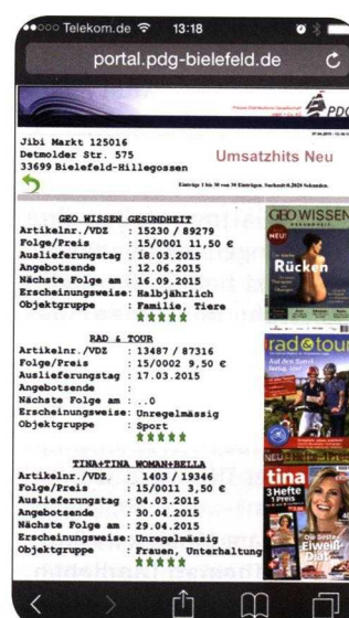
So sehen einige der Meldungen aus der App aus: Links eine „Kundenampel“, die über die Umsatzentwicklung im Vergleich zu anderen informiert, daneben die Anzeigen zu den Top-Sellern und Remissionaufrufe